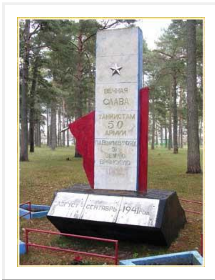
Памятник танкистам 50-й армии