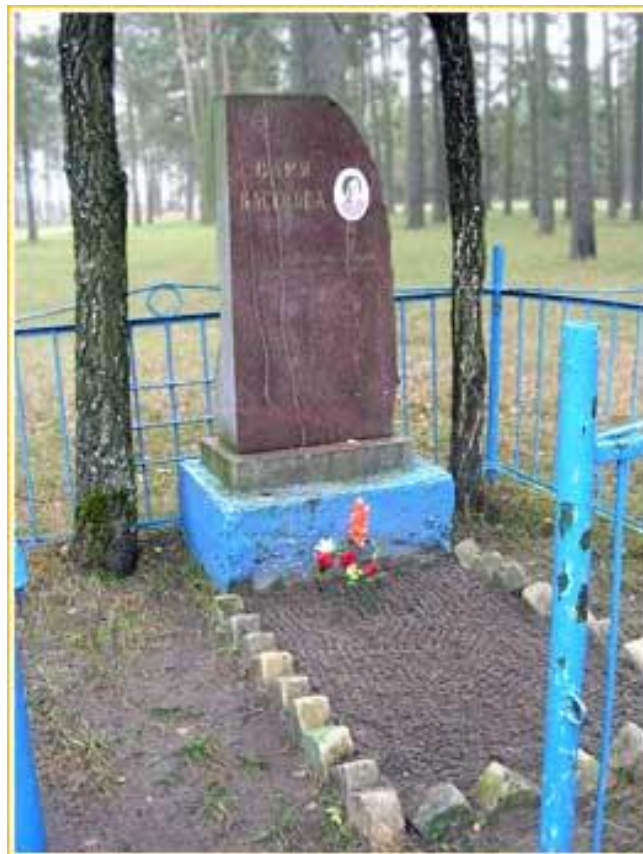
Памятник Вале ВАСЮКОВОЙ

Долгие годы за памятником ухаживали учащиеся школы №1. Сейчас за памятником Вари Васюковой ухаживают учащиеся школы №3. Они заменили памятник на гранитный. Ежегодно красят оградку.