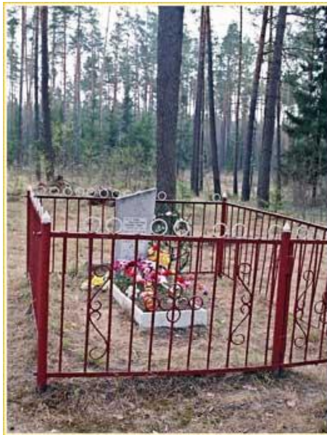
Памятник на могиле Неизвестного солдата