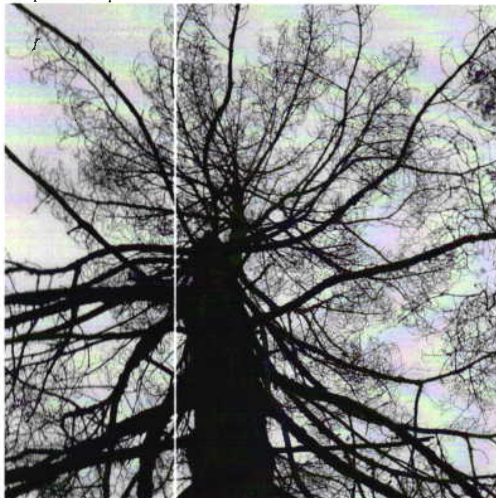
Аварийное дерево №1