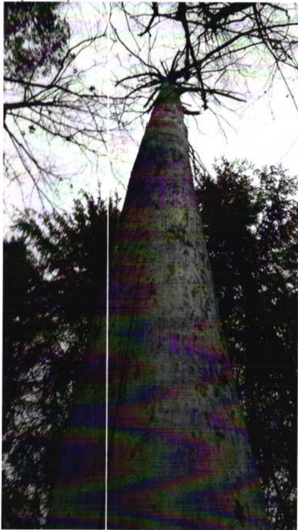
Аварийное дерево №1