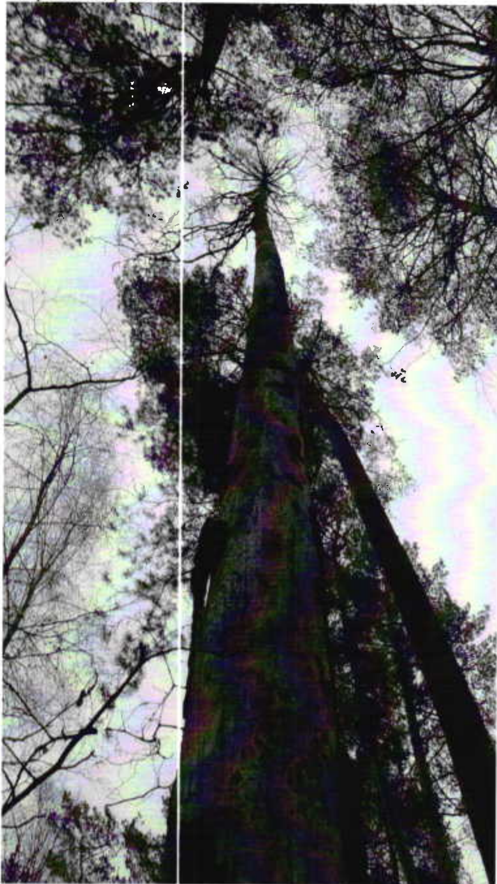
Аварийное дерево №1